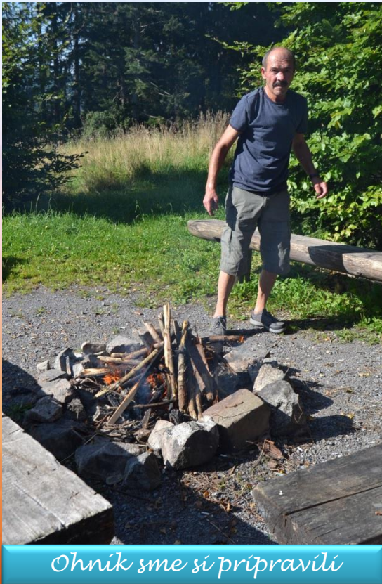
Ohník sme si pripravili

Ďalší z pekných septembrových dní sme sa rozhodli využiť na poslednú „opekačku“ v roku. Ráno sme nakúpili špekačky, čerstvý chlebič a „hor sa“ opekať. Ku chate sme sa vyviezli autom, v lese nazbierali raždie, poumývali stoly a tak sme mohli začať opekať. Oheň praskal, špekačky sa pekli, okolím sa šírila lákavá vôňa a znel spev našich prijímateľov. No, aby sme neostali len pri jedle, rozhodli sme sa vybrať na krátku prechádzku prírodou. Cieľ bol jasný – navštíviť prírodné jazierka. Krok sem, krok tam, ubiehalo nám to veľmi rýchlo. Cestou sme nazbierali hriby, na ktoré sa nám zbíhali slinky – „mňam“. Spoločne sme prežili ďalší krásny deň a úspešne sme uzavreli „špekáčikovú“ sezónu. Ďakujeme 😊