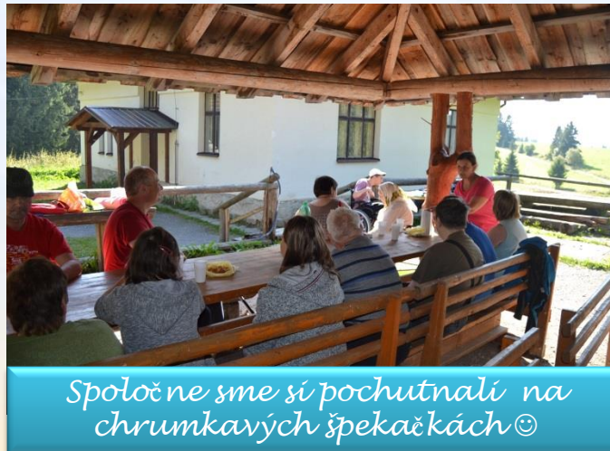
Spoločne sme si pochutnali na chrumkavých špekačkách 😊